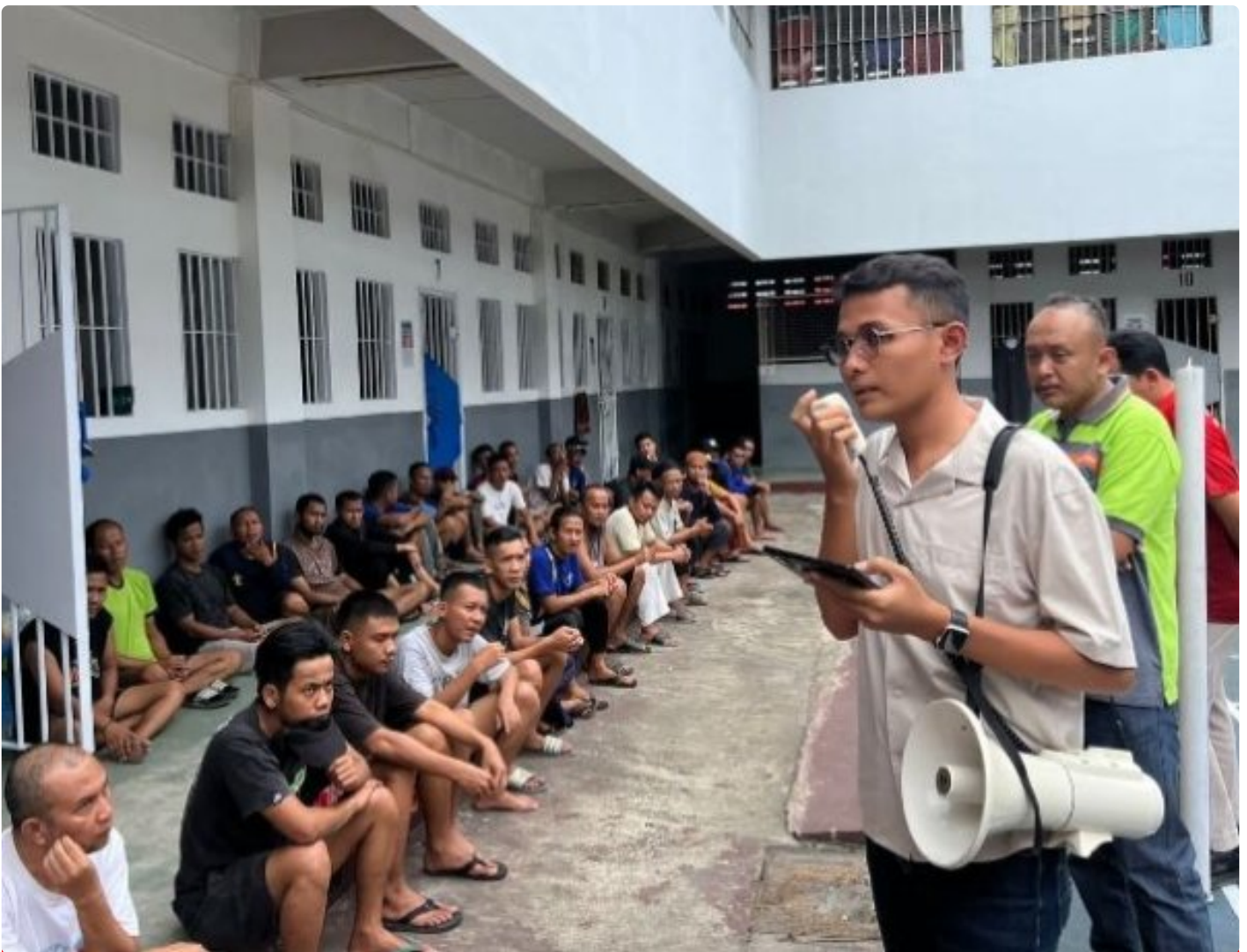
Lapas Purwokerto Sosialisasikan Hak dan Kewajiban bagi Warga Binaan

PURWOKERTO Lembaga Pemasyarakatan Kelas IIA Purwokerto menggelar kegiatan sosialisasi mengenai hak dan kewajiban warga binaan pemasyarakatan, dengan menekankan bahwa segala bentuk pengusulan pembebasan bersyarat dan program integrasi lainnya, dilakukan tanpa dipungut biaya, pada Sabtu (19/10/2024).